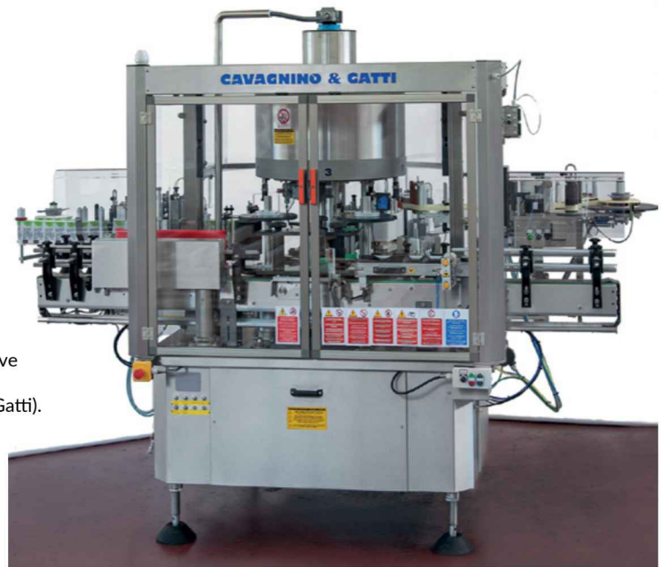
Macchina per etichette adesive serie TL-MP (Cavagnino & Gatti).

inoltre dotate di sistemi per l'orientamento meccanico da tacca laterale e su fondo bottiglia.